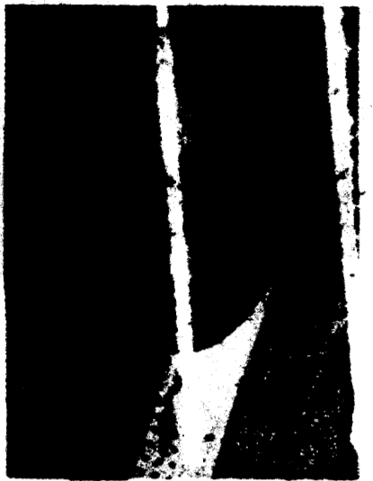
L'ex giudice Salvo La Torre

In carcere l'ex presidente del tribunale e il magistrato di sorveglianza. Il primo avrebbe assolto un boss per 70 milioni e l'altro venduto permessi ai detenuti. Bordate dalla Procura messinese contro i colleghi di Reggio che conducono l'inchiesta. PAGINE 4, 5 E 6